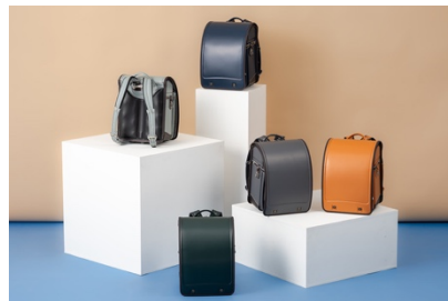
トラッドスタイルのイートンクラブに新色「チャコールグレー×チョコ」が追加